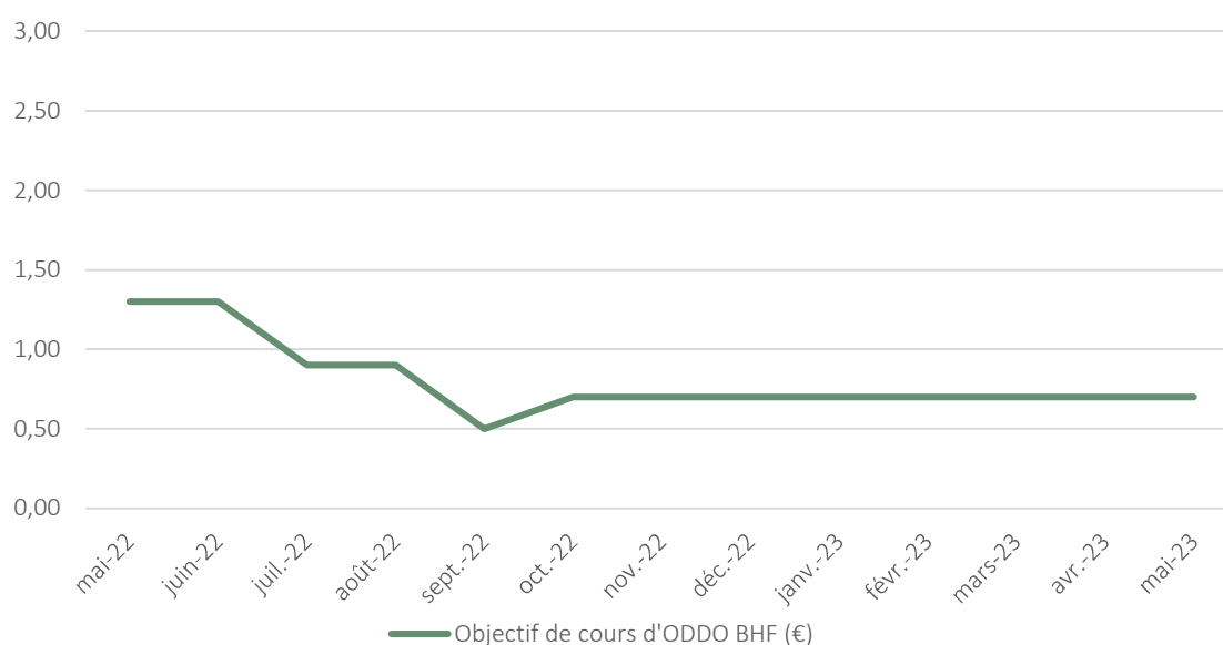
Figure 10 : Evolution de l'objectif de cours d'ODDO BHF AIF

Le 20 avril 2023, ODDO BHF AIF présentait un objectif de cours de 0,70 € par Action Ordinaire.